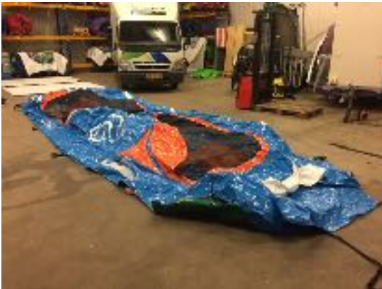
Foto 1: Koppel de blower los, open de ritssluitingen en laat het springkussen even liggen zodat alle lucht kan ontsnappen.

Loop zonder schoenen het speeltoestel volledig plat en druk zo alle lucht eruit.