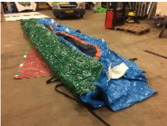
Foto 2: Vouw 1 lange zijkant met 2 personen terug naar het midden toe.

Loop zonder schoenen het speeltoestel volledig plat en druk zo alle lucht eruit.