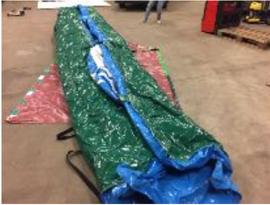
Foto 3: Vouw de andere lange zijkant tegen de andere kant aan. Klap de lange slurf van de blower-aansluiting terug naar binnen.