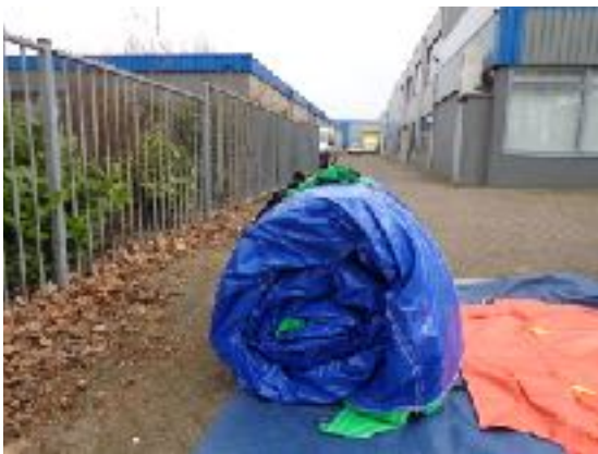
Foto 5: Rol de strook STRAK op!!! 1 of 2 personen rollen langzaam alles op, terwijl een andere persoon vlak vóór de rol uitloopt en alles platloopt.

Als alles recht en strak is opgerold doet u de spanriemen er om heen trekken.