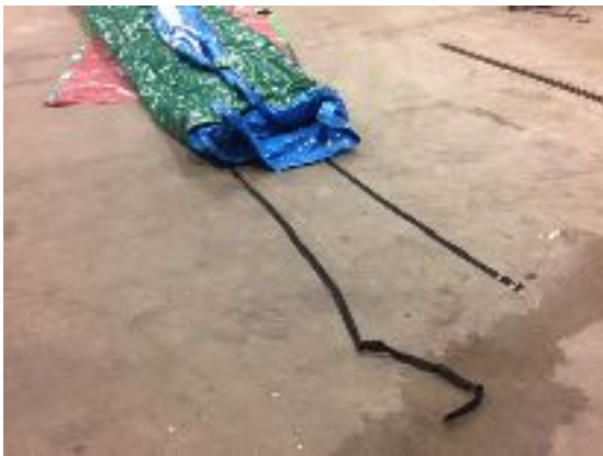
Foto 4: Leg aan de achterkant al de riemen onder de strook, dan hoeft u straks de rol niet op te tillen!