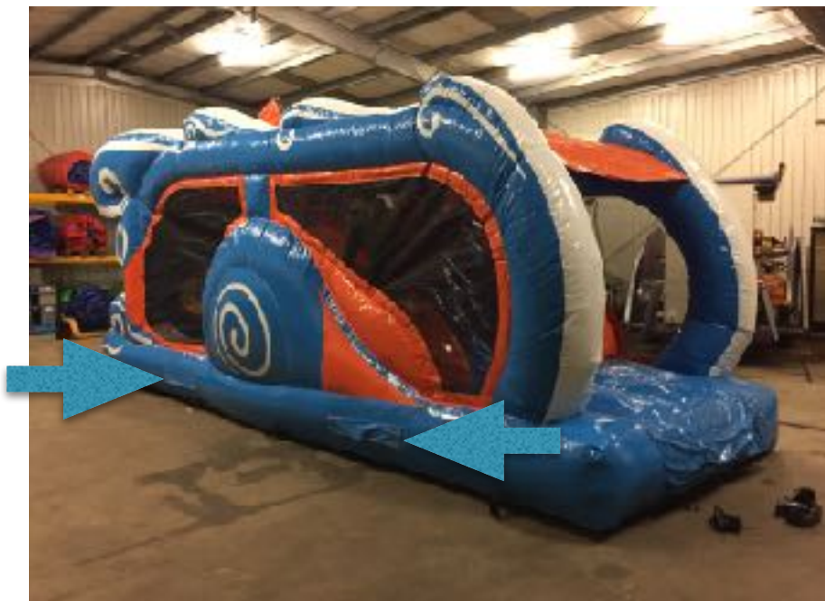
Foto: Locatie van de 2 ritssluitingen.